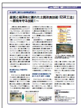
<カラー1ページ レイアウト見本>